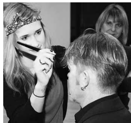
Vor der Party stylen. Nicht nur für Frauen ein Muss. Bei der Integrativen Party sorgten professionelle Visagistinnen für den richtigen Auftritt.