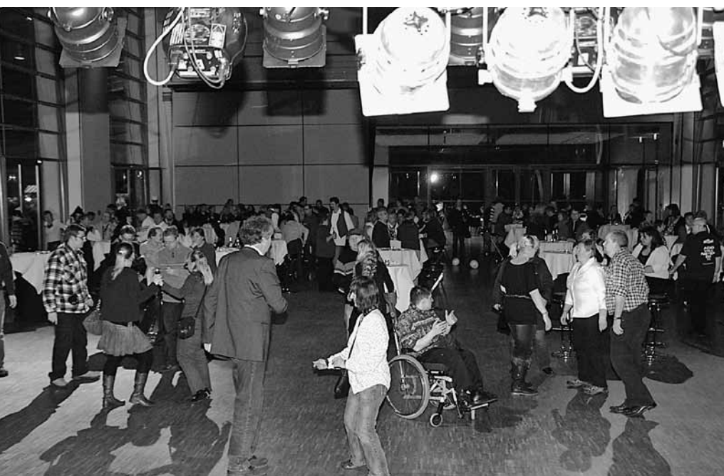
Immer eine volle Tanzfläche – bis in die frühen Morgenstunden. Integrative Party im Festspielhaus ist eine tolle Sache.