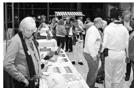
Erst einmal umschauen. Gedränge vor dem Partyraum. Erst mal warm machen und dann loslegen.