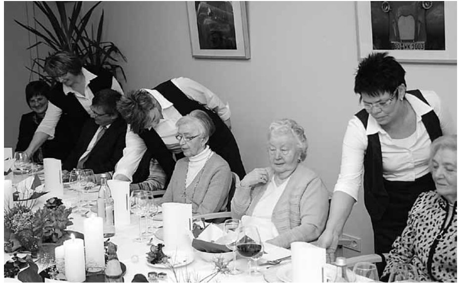
Das Ergebnis eines langen Schultages. Eine festlich gedeckte Tafel und ein wunderbares Menü.

Alle diese und noch viel mehr Fragen wurden im Februar bei einer Service-Schulung des Wirtschaftsbetriebes angesprochen. Eingeladen dazu waren Mitarbeiterinnen aus den Altenwohn- und Pflegeheimen des Diakonischen Werkes. Gemeinsam mit der Firma Apetito, dem Lieferanten von Essenskomponenten, wurde zunächst die Theorie angesprochen. Dabei aber blieb es nicht. Jeweils eine Teilnehmergruppe bereitet ein mehrgängiges Menü vor und sorgte für einen festlich gedeckten Tisch. Der Höhepunkt kam dann am Abend. Bewohnerinnen und Bewohner aus dem Theodor-Fliedner-Haus, Mieterinnen der angrenzenden Wohnanlage sowie einige Mitarbeitende waren eingeladen, das Ergebnis des Schultages zu erleben. Vom Empfang der Gäste über den festlich gedeckten Tisch bis zum servierten Menü – alle Elemente eines gastfreundlichen Hauses wurden an diesem Abend angesprochen. Gefallen hat es allen. Sowohl das leckere Essen, als auch der freundlich-professionelle Service. Der Applaus am Ende war laut, anhaltend und herzlich.