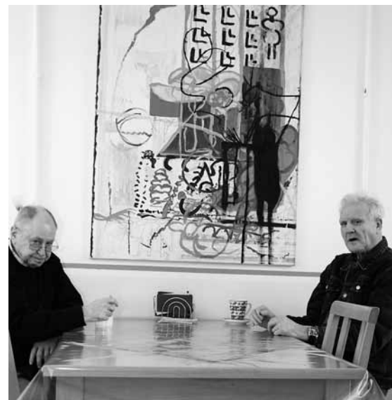
Die Bilder von Elmar Dengg schmücken Wände in der Tagesbetreuung und im Wohnheim.