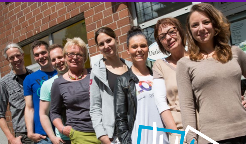
Unser Jugendhilfestation Team

In der Beratung werden mögliche Lösungswege gemeinsam entwickelt. Wird weitere Unterstützung benötigt, kann die Vermittlung in andere Angebote oder eine Überleitung in die Jugendhilfe erfolgen.